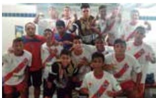
Campeonato Metropolitano de Futsal Pág. 15