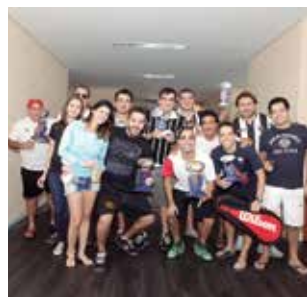
Torneio Interno de Squash Pág. 34