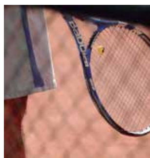
Torneio Interno de Tênis Pág. 35