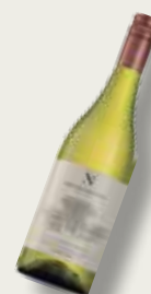
Sugestão de Harmonização: Neethlingshof Chenin Blanc 2014 – África do Sul.

Nascido e criado nas terras Mineiras. Relações Públicas e Cozinheiro por paixão. Em cada receita, uma experiência com pitadas de surpresa e sabor!