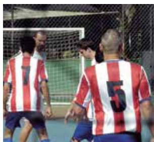
Torneio Interno de Futsal Pág. 34