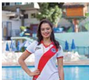
Lojinha do Olympico Pág. 21