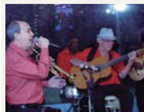
Seresta no Clube Pág. 22