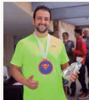
Dia dos Pais Pág. 20