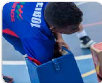
1º Sorteio - TV 42" (20/08/2015)

Os próximos sorteios serão nos dias 20 de setembro, 18 de outubro e 22 de novembro de 2015. Olympico e Mart Minas, transformando projetos em sucesso!