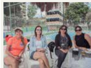
Música na Piscina Pág. 23