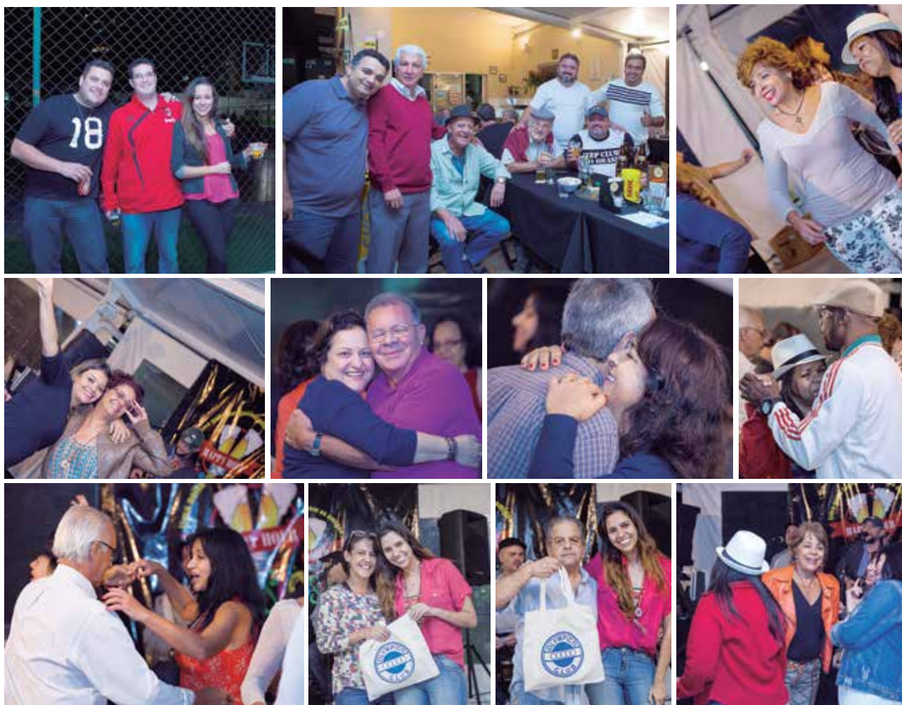
Divirta-se com mais fotos na fanpage: https://goo.gl/ygzFw6