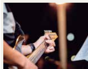
Happy Hour Pág. 26