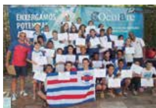
III Festival Nova Onda de Natação Pág. 16