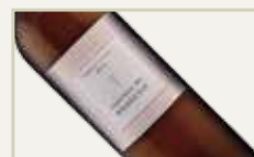
Sugestão de Harmonização: Bourdeaux Château de Rougerie 2010 – França.

Nascido e criado nas terras Mineiras. Relações Públicas e Cozinheiro por paixão. Em cada receita, uma experiência com pitadas de surpresa e sabor!