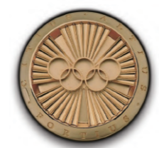
Medalha Pierre de Coubertin

qualidades morais e éticas e a demonstração do mais puro espírito esportivo em situações, difíceis ou inusitadas, acontecidas durante as disputas.