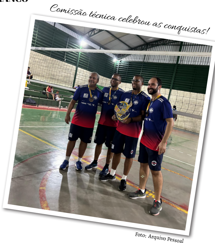
Comissão técnica celebrou as conquistas!